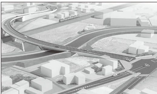
小俣立体全体イメージ