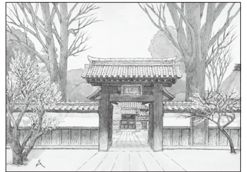
足利学校(学校門) 長島喜一画

平成27年6月議会にて財産の取得が議決される。(高規格救急車取得事業費4,000万円)